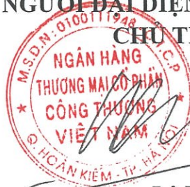
Lê Đức Thọ

NGƯỜI ĐẠI DIỆN THEO PHÁP LUẬT CHỦ TỊCH HĐQT